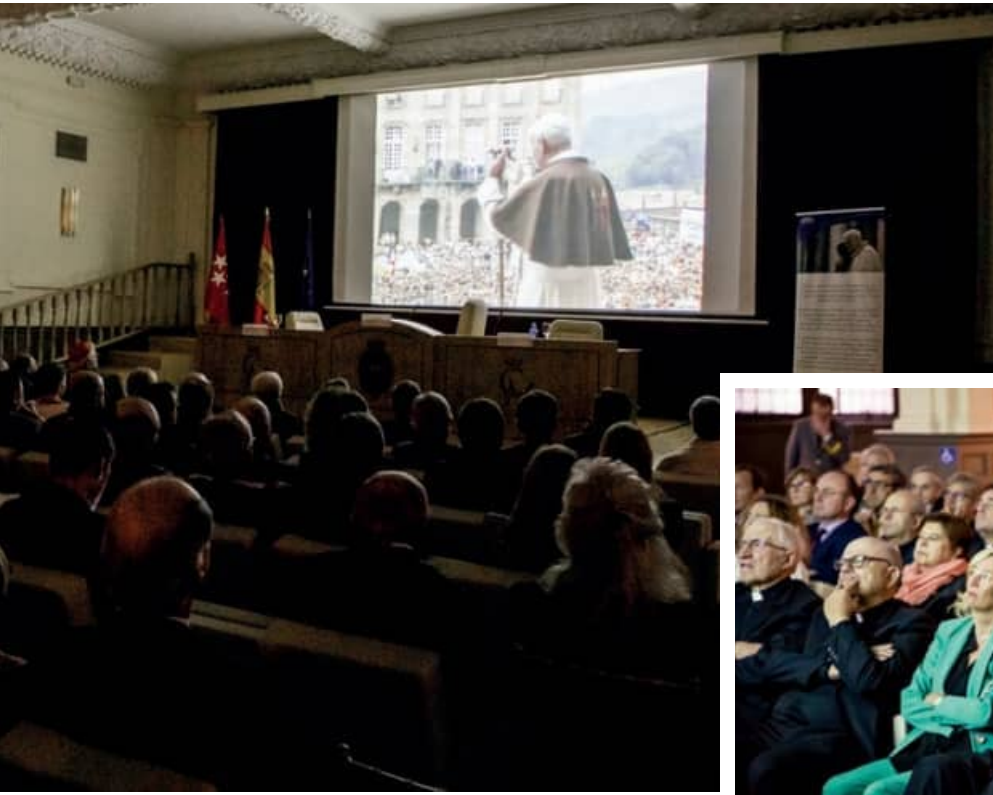
El cardenal Rouco Varela y el auxiliar Martínez Camino asistieron al acto celebrado en el Salón Príncipe