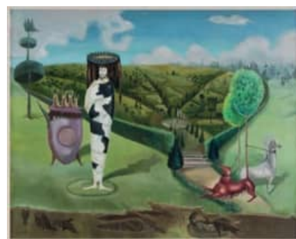
Leonora Carrington Green Tea (Té verde), 1942 Óleo sobre lienzo / Oil on canvas 61 x 76,2 cm - 145.2019 The Museum of Modern Art, New York. Gift of Drue Heinz Trust (by exchange), 2019 © Estate of Leonora Carrington / VEGAP, Madrid, 2022