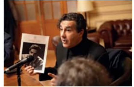
Encuentros de Teatro y Danza

Los Encuentros de Teatro y Danza, después del descanso del verano, volvieron en octubre, el día 19, con una figura fascinante, la cantante cubana, Alina Sánchez, la primera interprete de la zarzuela cubana de Gonzalo Roig, Cecilia Valdés, obra que la lanzó al estrellato y con la que inicio una carrera de éxitos en los grandes teatros de todo el mundo. Alina es, además, una mujer preparada, con una memoria prodigiosa. Canto parte de Bésame mucho y contó que Gonzalo Roig, el compositor de Cecilia Valdés, vendió esta canción por 5 pesos, porque no tenía dinero ni siquiera para comer. Es la vida del artista llena a veces de difi-