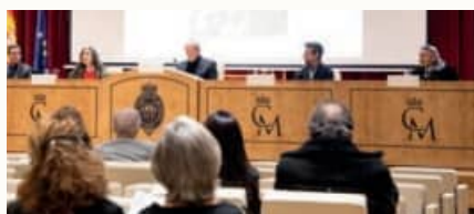
Tertulia Teatro y Danza