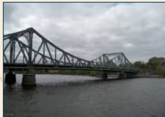
Famoso y cinematográfico "Puente de los Espías".