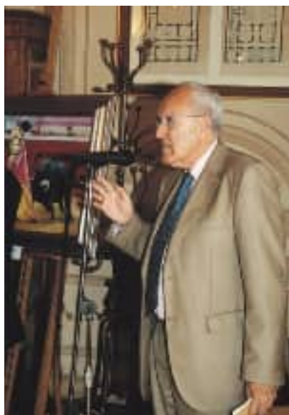
El Presidente del Casino de Madrid se dirige a los asistentes a la inauguración de la muestra, celebrada el 18 de mayo.