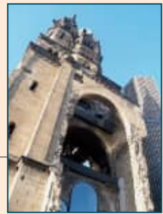
Iglesia que no fue reconstruida y así se conserva como prueba de lo que fueron los bombardeos.

monumental de "Sanssouci", obra cumbre del rococó berlinés, que significa sin preocupaciones. Los socios del Casino protagonizaron una divertida escena en la visita al edificio de invitados. Para entrar, era preceptivo colocarse, dentro de unas descomunales "pantuflos" de casi medio metro. La única forma de evitar que éstas se cayeran al caminar, era hacerlo arrastrando los pies. Ver ochenta personas "patinando" por los brillantes mármoles de Sanssouci no era una escena, precisamente solemne; con la particularidad de que cada uno podía ver el aspecto de los demás, pero no el propio. "¡Menudas pintas!", "¡Claro, ya pueden tener esto reluciente, si todas las visitas, además sacamos brillo!", "¡y gratis!", "¡no, que encima pagamos nosotros!", "y para colmo está prohibido hacer fotos, ¡con lo que nos íbamos a reír viéndonos con estas pintas!" ... Si a los ochenta patinando por los hermosos salones, además se añaden las ocurrencias de cada cual, huelga decir que el momento habría servido, sin duda, de inspiración a Chaplin, en la mejor de sus películas.