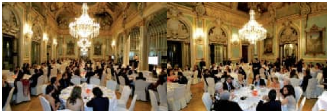
El Salón Real fue escenario de esta I edición de los Premios a la Solidaridad en el Deporte.