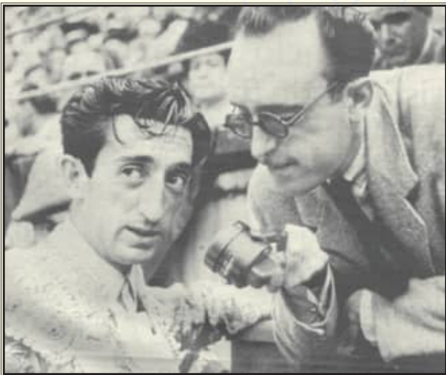
Con el diestro “Manolete”, a quien hizo su última entrevista en la plaza de toros de San Sebastián, días antes de su fallecimiento.

Nuestro ilustre consocio preparaba los momentos vacíos de las retransmisiones con especial cuidado. En los toros, acudía la mañana de las corridas a recoger información de los toros, criadores, toreros, areneros, etc. En el fútbol, se informaba de los nombres de los jugadores, procedencia, aspecto físico; e incluso buscaba información turística de las ciudades que visitaba. Para Don Matías, citar los antecedentes genealógicos de los toreros, maestros de mulillas, o quién fuera, era muy importante, porque aseguraba que nunca debíamos olvidarnos de nuestros orígenes y agradecer que hubiéramos nacido. Don Matías fue un genio de la improvi-