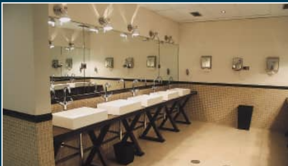
Las mejoras en el campo son más que evidentes, no sólo en cuanto a mantenimiento en general, si no en zonas concretas como los vestuarios o el campo de prácticas