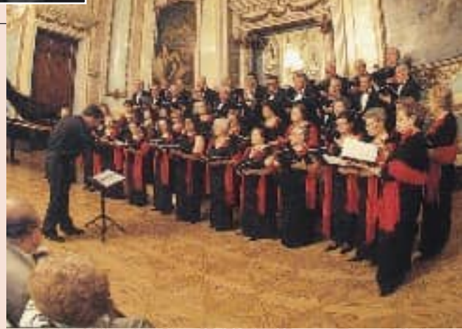
La Coral en un momento de su actuación, en el espléndido marco del Salón Real.