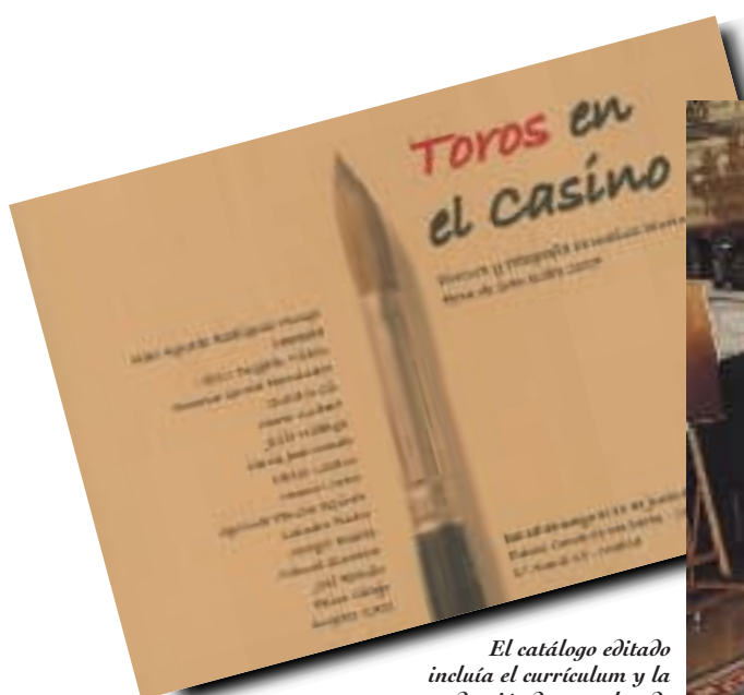
El catálogo editado incluía el currículum y la reproducción de una obra de cada uno de los autores.

Y así es, realmente el espacio es único: "nada que ver con las frías paredes de una sala de exposiciones" — afirmaba una de las asistentes a la inauguración—. El Salón del Torito, la Sala de Lectura y la galería de acceso a la Biblioteca, acogían las 22 obras que formaban la muestra.