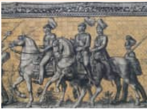
Dresde. Impresionante mural "Desfile de los Príncipes", realizado con 24.000 piezas de porcelana de Meissen.