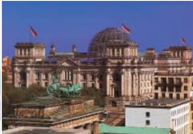
El Reichstag, tras los bombardeos, y en la actualidad.

“Pues en España hay límites, que no se cumplen, y el índice de accidentes es muy alto”... Otros socios aprovecharon para leer, o contemplar los inmensos campos amarillos, —que parecían de nabos y resultarían ser de colza—, que alternaban con el verde, creando con el azul del cielo, un paisaje espectacular con una gama cromática digna de una colección de postales.