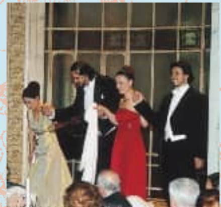
Arriba, los intérpretes saludan al público al término de una de las piezas.

Como es habitual, se ofreció un bello bis: el “Brindis” de “La Traviata”, de Verdi, una inmortal melodía que, a petición de los artistas, todo el público tarareó en los compases finales.