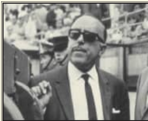
A la izquierda, recogiendo un Premio de la Academia de Televisión junto a su hijo en el año 2000. A la derecha, en la madrileña Plaza de las Ventas.