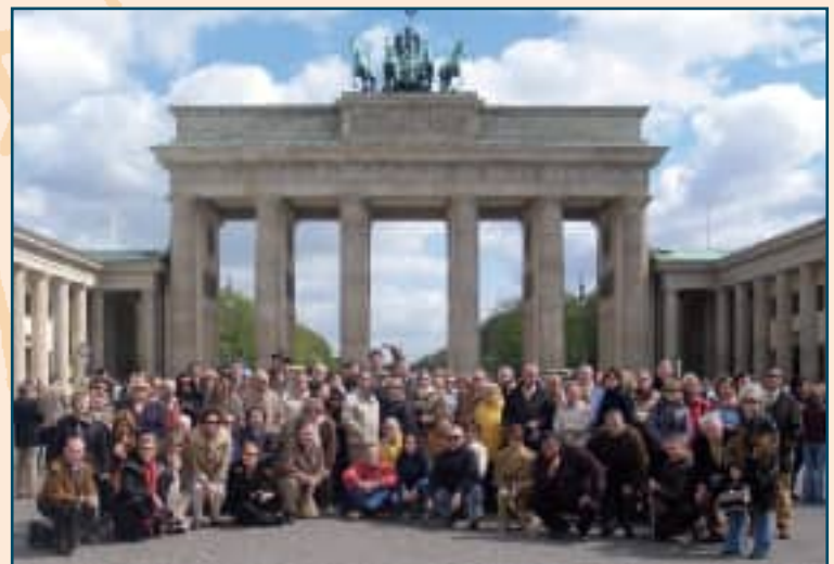
El grupo casinista ante la Puerta de Brandemburgo.