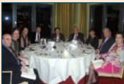
Cena de despedida en Berlín.