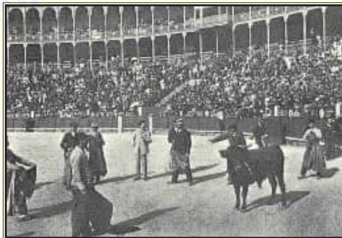
Becerrada celebrada en Las Ventas, hace ahora cien años.

Santa Cristina”. Sin duda, una curiosa celebración.