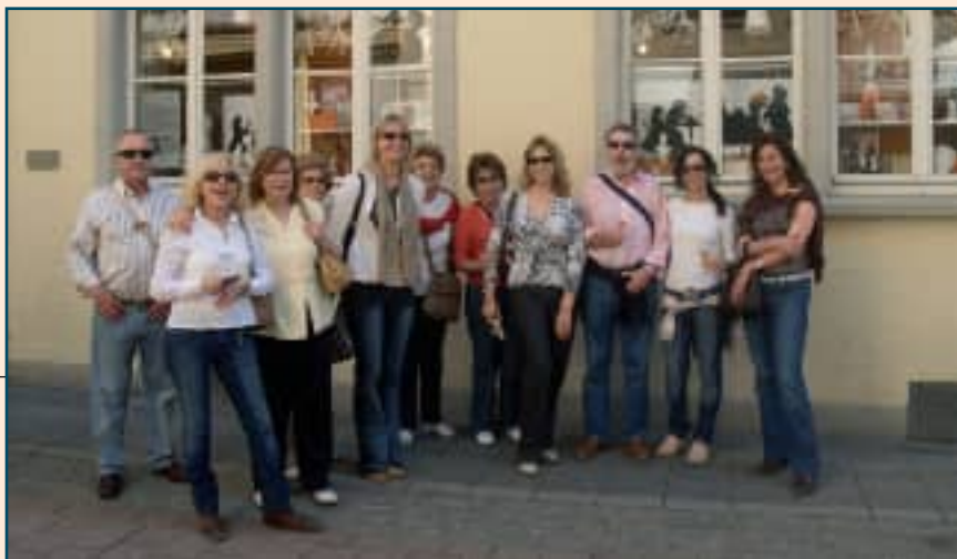
Izquierda, lugar de Loreley. Arriba, un grupo de socios posa ante la casa de Beethoven en Bonn. Abajo, a la izquierda, inconfundible Catedral de Colonia. Bajo estas líneas, dos imágenes en Heidelberg.

turistas un pueblo digno de figurar en su itinerario de visitas.