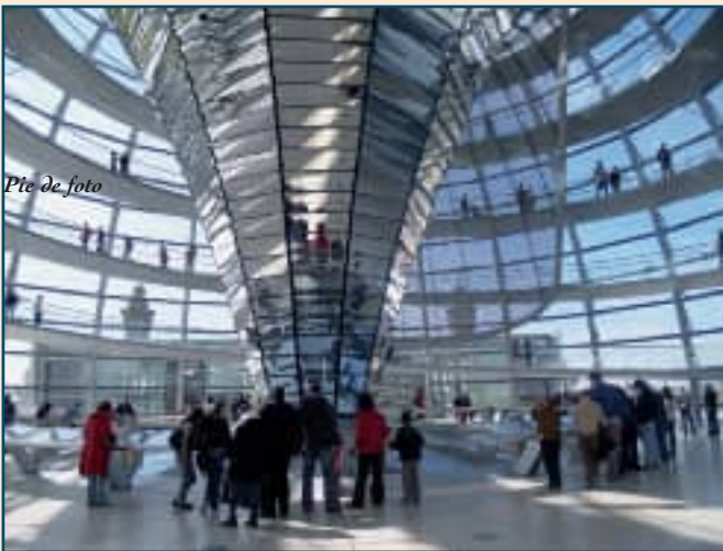
Pto. de foto