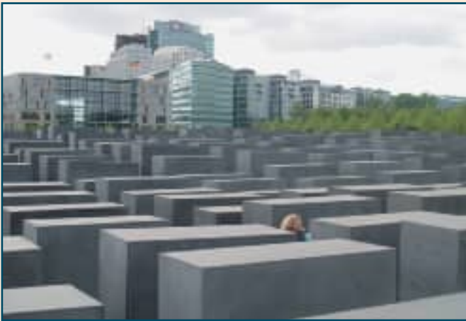
Cementerio judío, en Berlín.

de millón de personas; o el Museo de Pérgamo, que alberga piezas únicas, como el Altar, que sólo es posible admirar en Berlín.