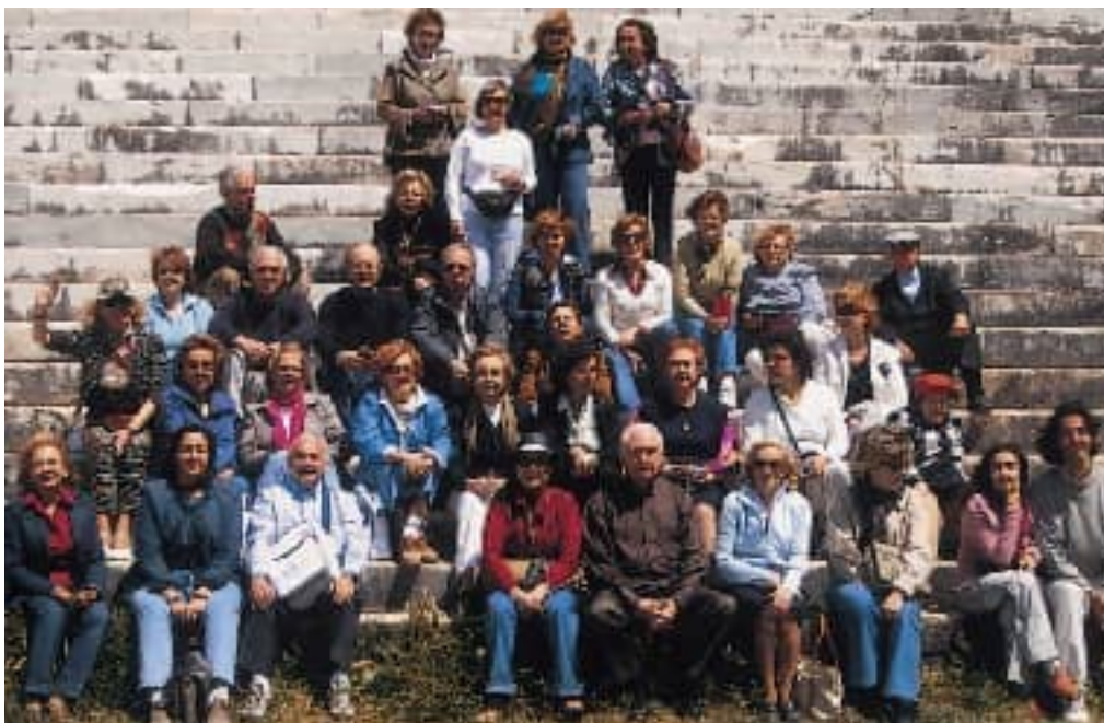
Imagen de los participantes en la llamada "Ruta de San Pablo", en Turquía.