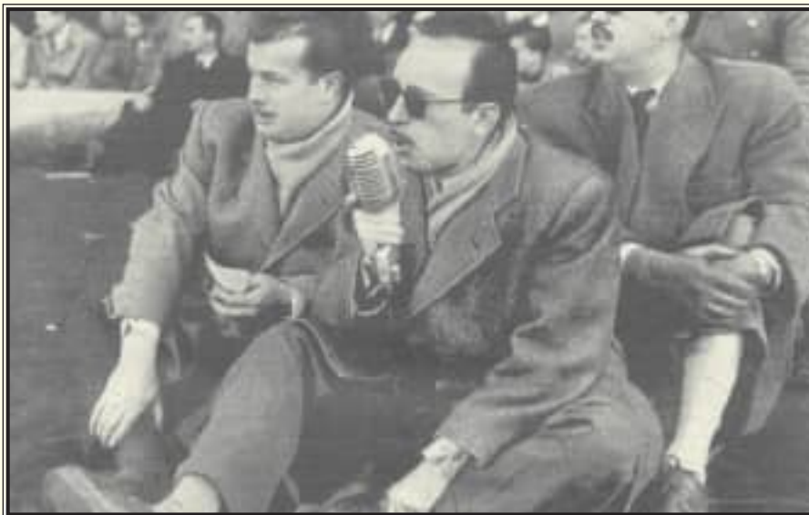
Matías Prats Cañete, comentando un partido a pie de campo; su personal estilo hizo historia.

siempre irónico, comentó: “Lo cierto es que trabajamos en la misma emisora, que ella estaba en frente de mi, pero no enfrentados y en medio había pausas para la publicidad ¿Y donde ibas a mirar?”.