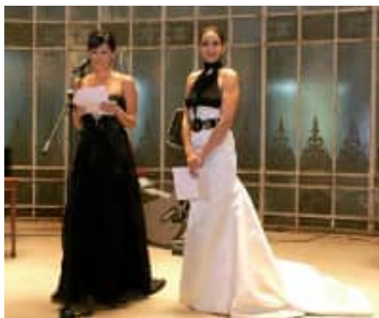
Las presentadoras del evento, María José Suárez y Elsa Anka.