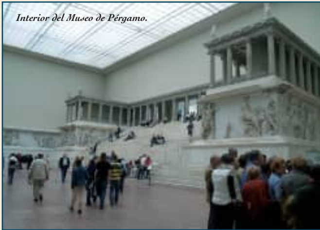
Interior del Museo de Pérgamo.

tá considerado como una de las más hermosas creaciones góticas; las vidrieras son espléndidas y originales; y además, en su interior se custodian las que se creen reliquias de los Reyes Magos de Oriente. ¡Qué más se puede pedir! Pues sí. Muchas más cosas, entre ellas que la ciudad haya dado nombre en todo el mundo al agua de colonia. Su origen era un “agua maravillosa” que se utilizaba para curar los ataques de tos. ¿Quién se lo iba a decir al italiano Johann María Farina, que