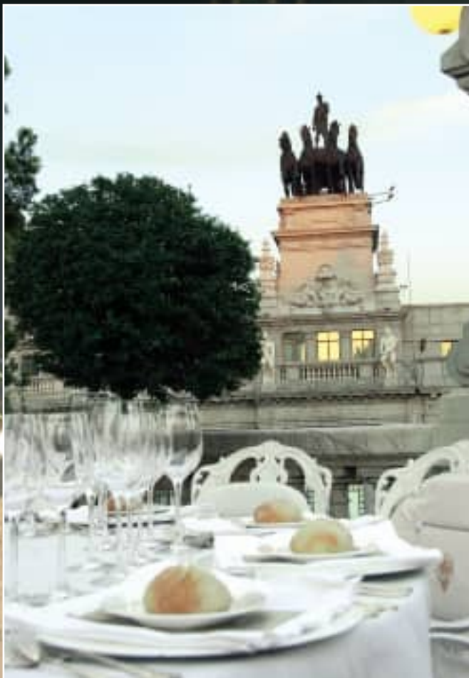
Las mesas, espléndidamente preparadas, esperaban a los invitados.

de sentido: "Por los socios del Casino". Todos los asistentes alzaron entonces sus copas para celebrar esta exitosa Fiesta de Primavera-Verano.