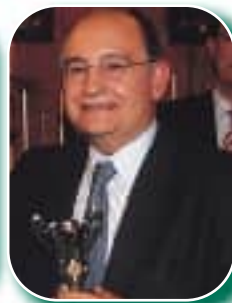
Varias imágenes de la entrega de trofeos; todos los participantes, tuvieron premio.