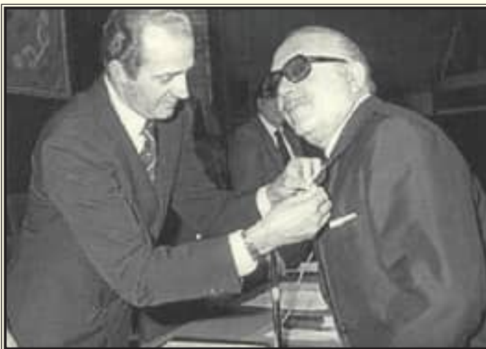
S. M. el Rey imponiéndole una condecoración que reconocía su impecable trayectoria profesional.