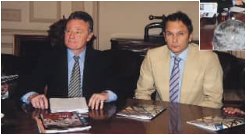
Dos imágenes de la Tertulia Taurina que contó con la visita de Julio Aparicio.