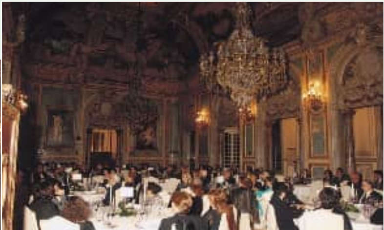
Bellas e impresionantes imágenes del Salón Real.

de Música de Salamanca. Su capacidad para trascender sus interpretaciones, ha hecho que sus conferencias-concierto hayan sido solicitadas en todos los lugares donde la cultura manifiesta especial devoción a la música. Como concertista, tanto como solista de piano, como acompañado de grandes orquestas, sus actuaciones se cuentan por éxitos, y lo mismo en España, que en el extranjero, ha logrado que los críticos más exigentes hayan escrito sobre él en los términos más elogiosos”.