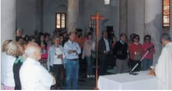
Tres imágenes del viaje a tierras turcas.

Pamukkale de Frigia. Actualmente Pamukkale es un lugar único en el mundo con sus famosas cascadas blancas de agua petrificada, mientras que de la antigua ciudad de Hierápolis destaca su inmensa necrópolis de alrededor de 2 km. de longitud.