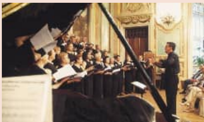
La Coral ofreció diversas composiciones, en los que combinaron temas de corte clásico de los viejos cancioneros.