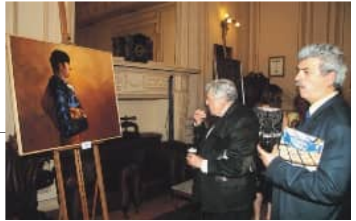
El Salón del Torito, la Sala de Lectura y la galería de acceso a la Biblioteca, acogían las 22 obras que formaban la muestra.