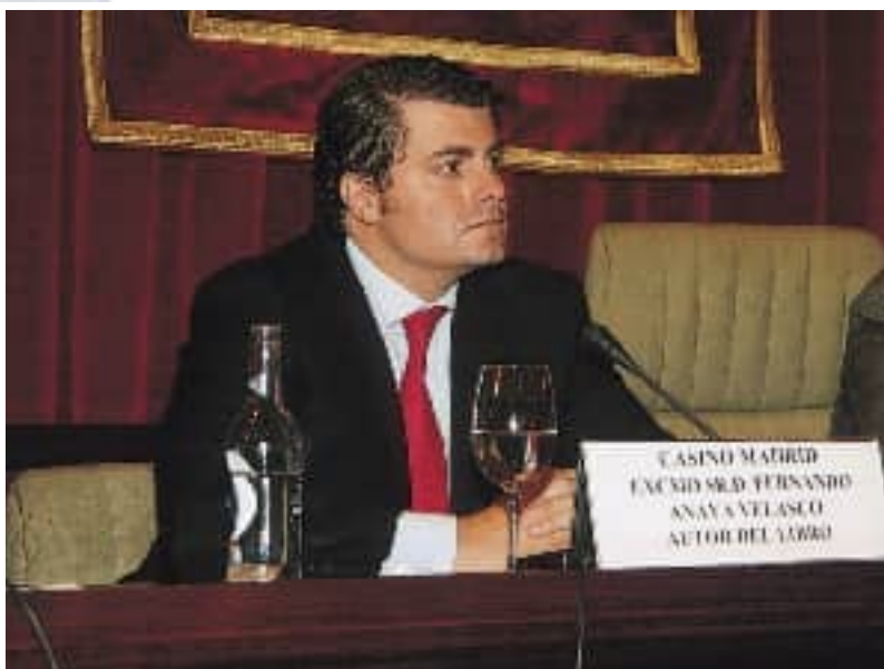
El autor, en un momento de la celebración del acto de presentación de su última obra.