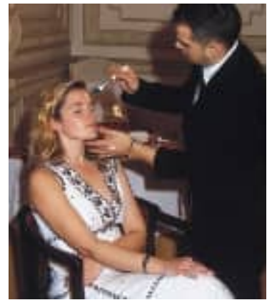
En una de las reuniones de las Señoras Socias, se dieron a conocer las últimas tendencias de maquillaje de la casa francesa Clarins.

Los casinistas más jóvenes siguen celebrando con éxito sus citas semanales con destacadas personali-