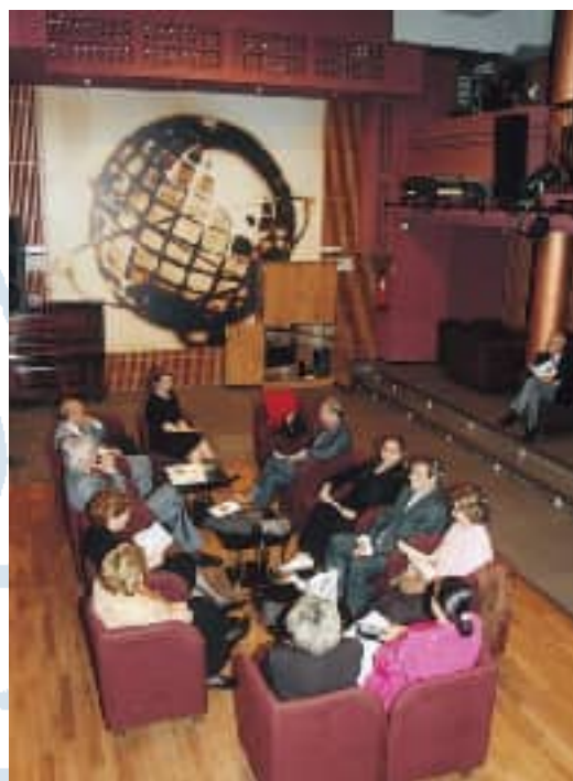
Imagen del emotivo homenaje que la Tertulia Musical rindió a tres tertulianos recientemente fallecidos.

El Casino de Madrid también cuenta con una Tertulia Marinera, que sigue congregando a numerosos socios en cada una de sus convocatorias.